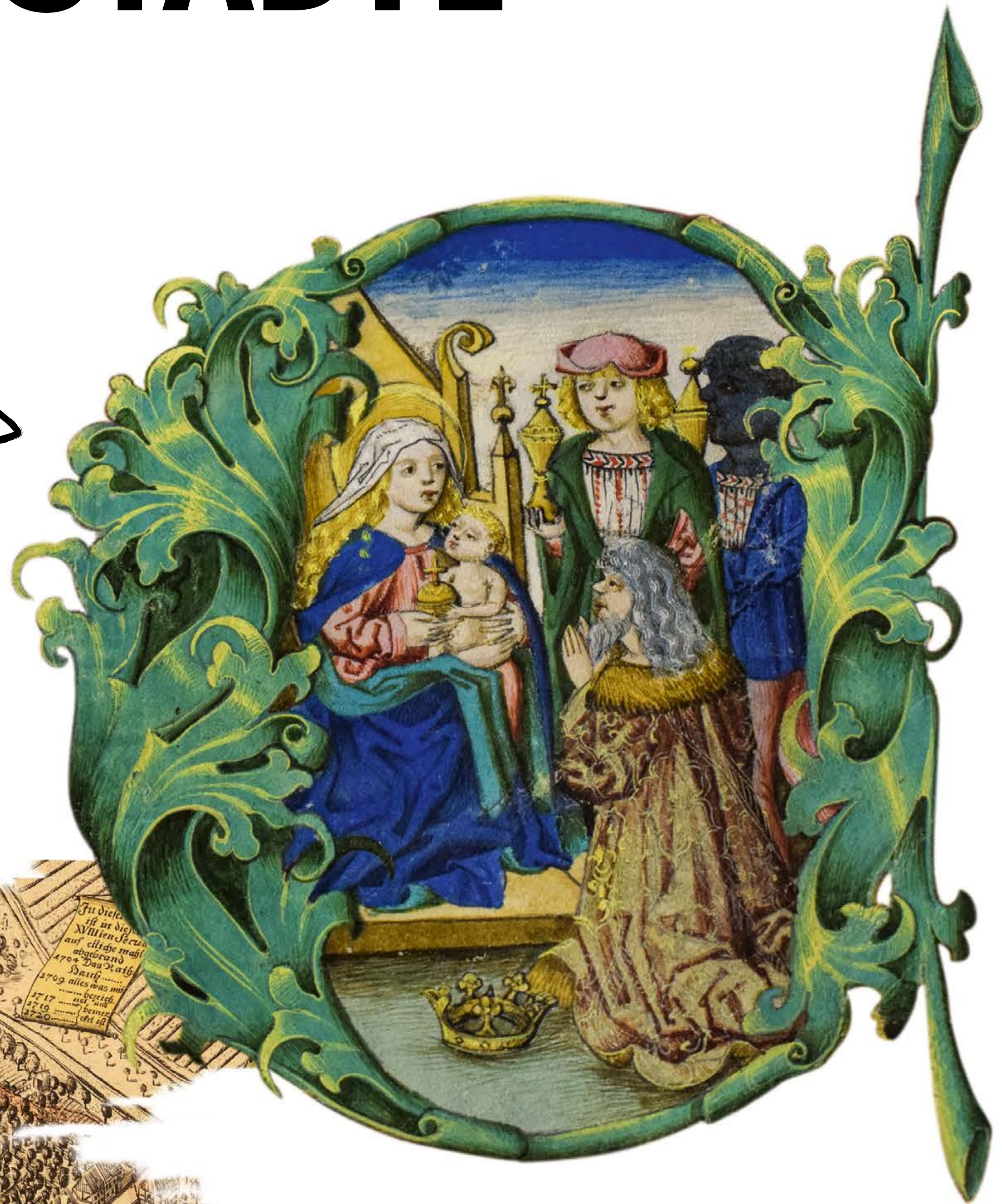
Illustration aus einem Zittauer Messbuch von 1512

Stowiński gród owalny wzniesiony na obszarze pre- historycznego grodu